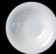
Deep Plate P059 30.0cm (11¾") 100.0cl (35oz) P060 21.0cm (8") 38.0cl (13oz)