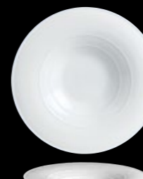
Broad Rim Pasta Plate P008 30.0cm (11¾") Well Size 14.0cm (5½")