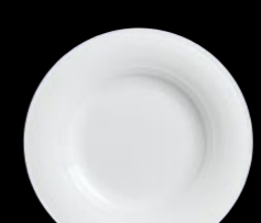
Flat Rim Coupe Plate P007 30.0cm (11¾")