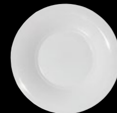
Broad Rim Medium Well Plate P001 30.0cm (11¾")