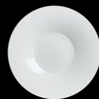
Broad Rim Small Well Plate P005 30.0cm (11¾") Well Size 12.0cm (4¾")