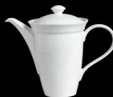
Coffee Pot P152 36.0cl (11¾oz) P157 Lid fits 6300P152 P154 60.0cl (21oz) P159 Lid fits 6300P154