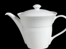
Teapot P153 45.0cl (16oz) P197 Lid fits 6300P153 P155 65.0cl (22½oz) P199 Lid fits 6300P155