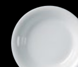
Cereal Bowl P091 14.0cm (5½") 50.0cl (17½oz) P092 16.0cm (6¼") 22.0cl (7¾oz)