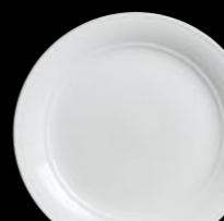
Medium Rim Plate Large Well P006 30.0cm (11¾") Well 14.0cm (5½") P307 28.0cm (11¼") P302 27.0cm (10¾") P303 24.0cm (9½") P304 22.0cm (8¾") P305 17.0cm (6¾") P306 15.0cm (6")