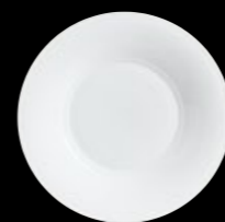
Broad Rim Plate P015 28.0cm (11") P016 24.0cm (9½") P017 20.0cm (8") P004 16.0cm (6¼")